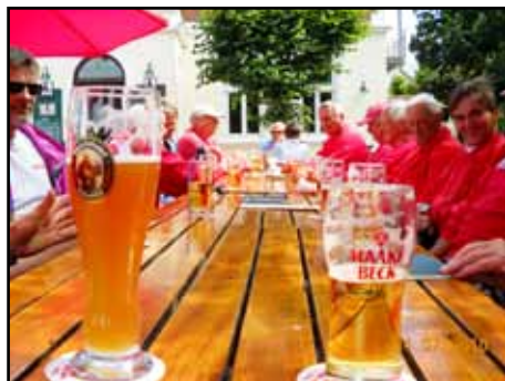
Franziskaner statt Kirche

Bei der Einfahrt zu Gartelmann droht das Scheitern der Expedition, denn das Gasthaus Gartelmann liegt nicht direkt an der Wümme, sondern ist zu Wasser nur über einen knapp 100 m langen Seitenarm zu erreichen. Dieser Arm war ehemals die Zufahrt von der Wümme zur und der Wasserlieferant der Semkenfahrt. Die Schleuse neben dem Gasthaus Gartelmann wurde 1995 dichtgemacht, und seitdem kann der Seitenarm nur noch bei einer gewissen Fluthöhe befahren werden, er droht zu verschlicken. Hier nun wird bestraft, wer zu früh kommt im Leben, denn dann reicht der Wasserstand noch nicht aus und das Boot steckt fest. Wir kamen umgerechnet etwa eine Bierlänge zu früh dort an, laufen auf eine Schlickbank auf und müssen fast 30 Minuten warten, bis wir das Objekt unserer Begierde erreichen.