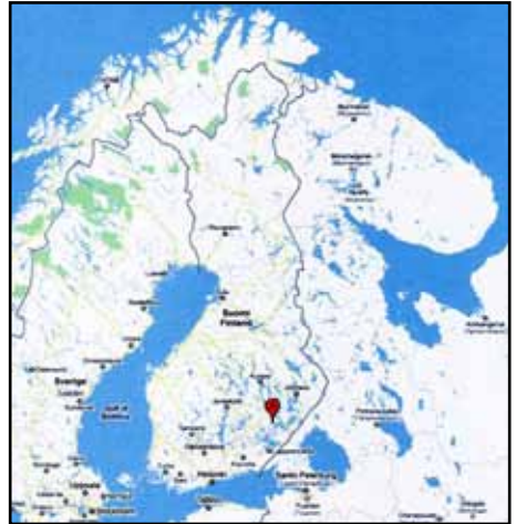
Finnland und Saimaa-Seenplatte

ge beträgt etwa 12 m, die Breite liegt bei knapp 1,85 m, das Gewicht beläuft sich auf 300 kg und es bietet 14 paarweise sitzenden Ruderern und einem Steuermann Platz.