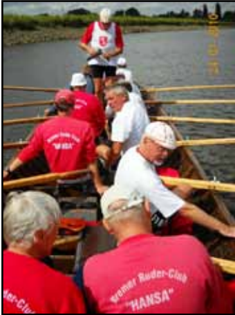
Charly bei der Ausgabe des chinesischen Weißweins zum Behufe der Verkostung

(Jürgen) B. findet sich ein Behältnis chinesisches Weißweins. Und wer schon einmal die ARTE-Sendung mit Foodhunter Mark Brownstein gesehen hat, der